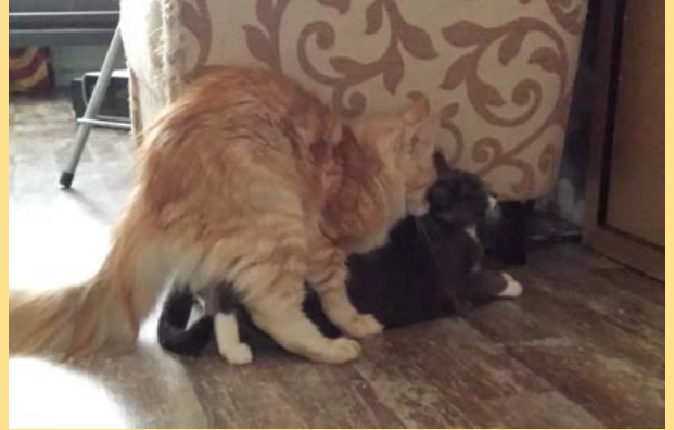
2 Dekking van de poes door de kater.

Zowel poezen als katers worden gecastreerd. Het is dus NIET zo dat poezen worden gesteriliseerd en katers gecastreerd. Dat is een mythe. Ze ondergaan beide dezelfde behandeling en die heet castratie.