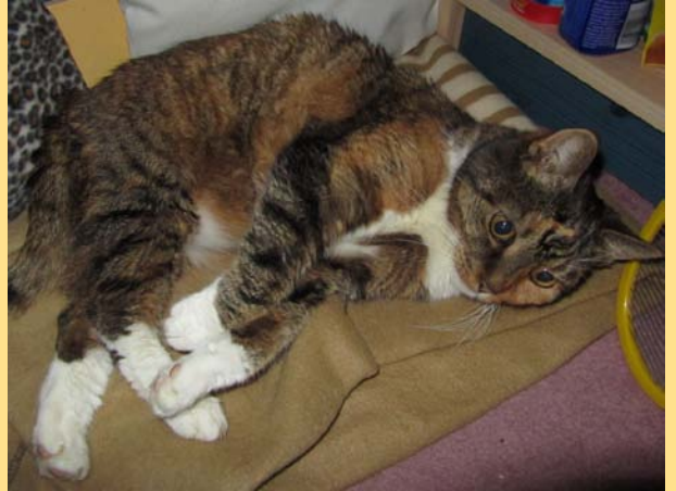
4 Kat van 16 jaar met ouderdomskwalen: niet meer goed ter been, dus kleeft op de grond.