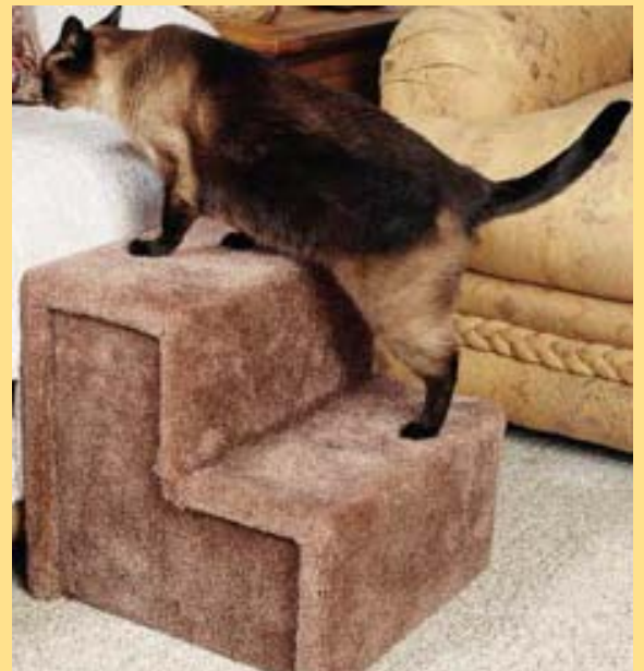
3 Gelukkig oud worden: help je kat als hij wat strammer wordt.