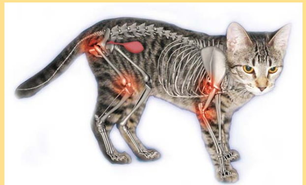
5 Het gestel van een kat met pijnpunten bij oudere katten

Zorg ook altijd voor voldoende drinkmogelijkheden.